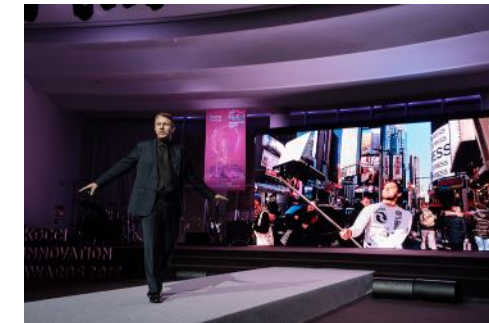
German-Korean Chamber of Commerce Seoul, Südkorea

Zielgruppen: Mitarbeiter*innen und Führungskräfte, Organisationen und Verbände, Kunden- und Partnertage von Unternehmen