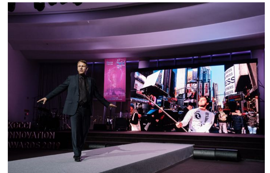
Deutsch-koreanische Handelskammer Seoul