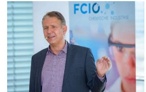
Fachverband Chemie Österreich Wien