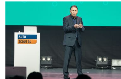
Autoscout24 Zürich, Schweiz