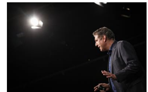
Mercedes Benz Managementkonferenz Berlin