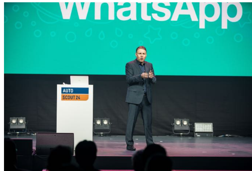
Pirelli Night / AutoScout24 Zürich