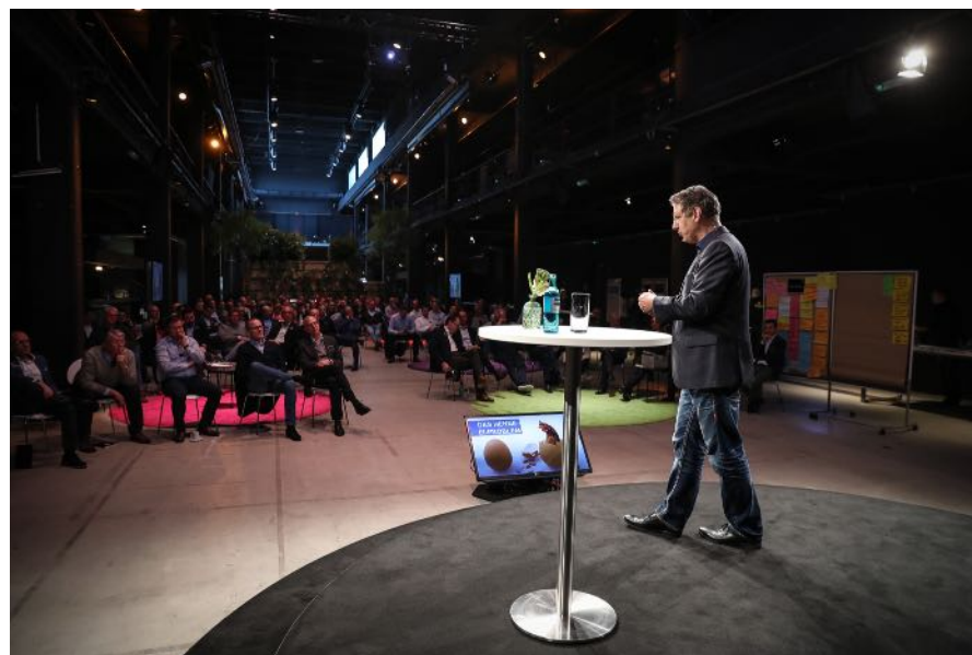
Mercedes-Benz Retail Berlin